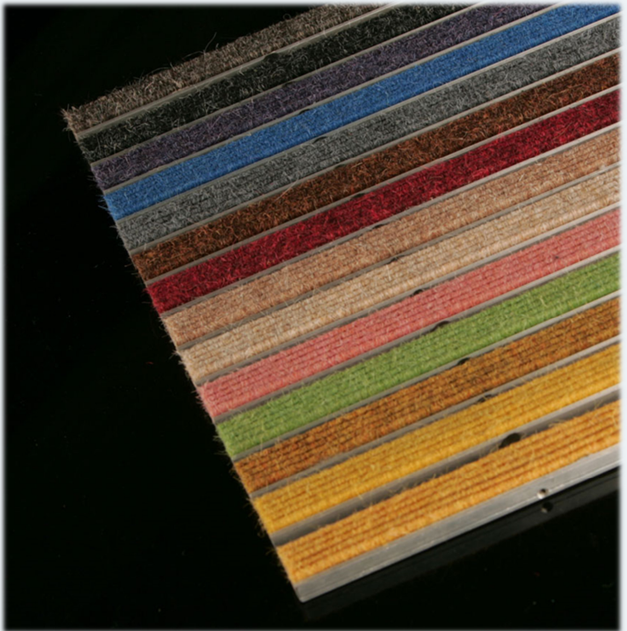
(Abb.: 3mm Profilabstand, regenbogenfarben)